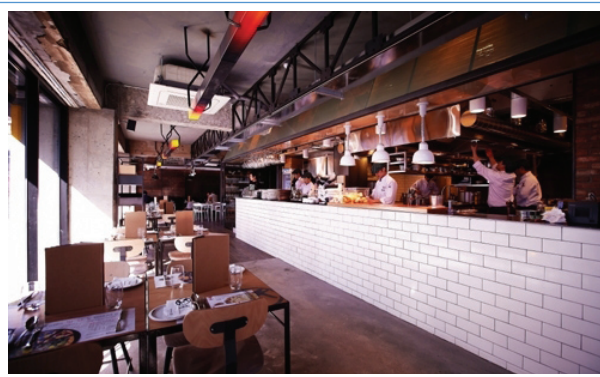
블랙스미스(이탈리안 요리 전문, 누룽지 등 한식 활용 퓨전요리)

* ‘한류 4대 천왕’ : 이병헌, 장동건, 송승헌, 원빈 ‘09년 도쿄돔에서 공동 팬미팅을 갖기도 함